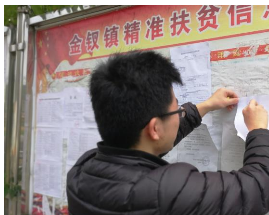
图 8 金钗镇政府公示