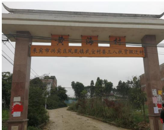
图 5 黄海村公示

建设单位于 2019 年 4 月 16 日~4 月 18 日，建设单位在沿线敏感点公告栏粘贴项目环境影响报告书征求意见稿公告公示。截图见图 5-图 10。