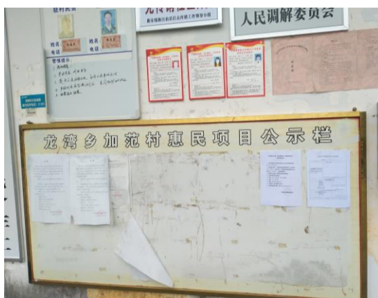
图 7 加范村公示