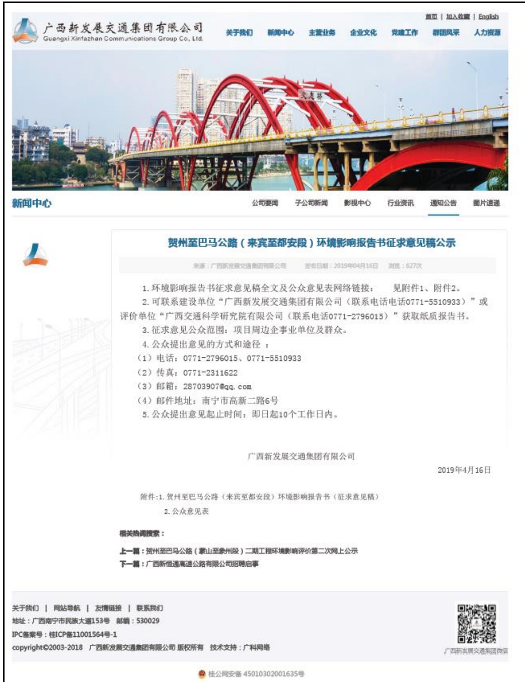
图 2 环境影响报告书征求意见稿网站公示