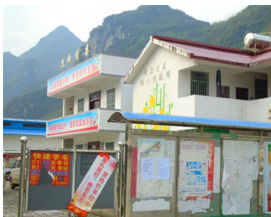
图 6 六纳村公示