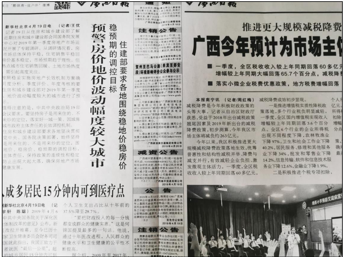
图3 项目征求意见稿在第24748期《广西日报》第一次公示