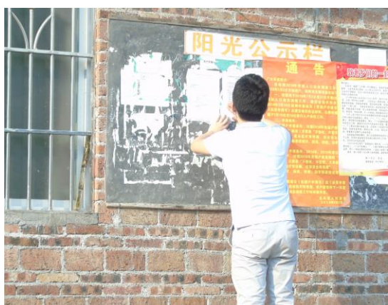
图 9 厂上村公示