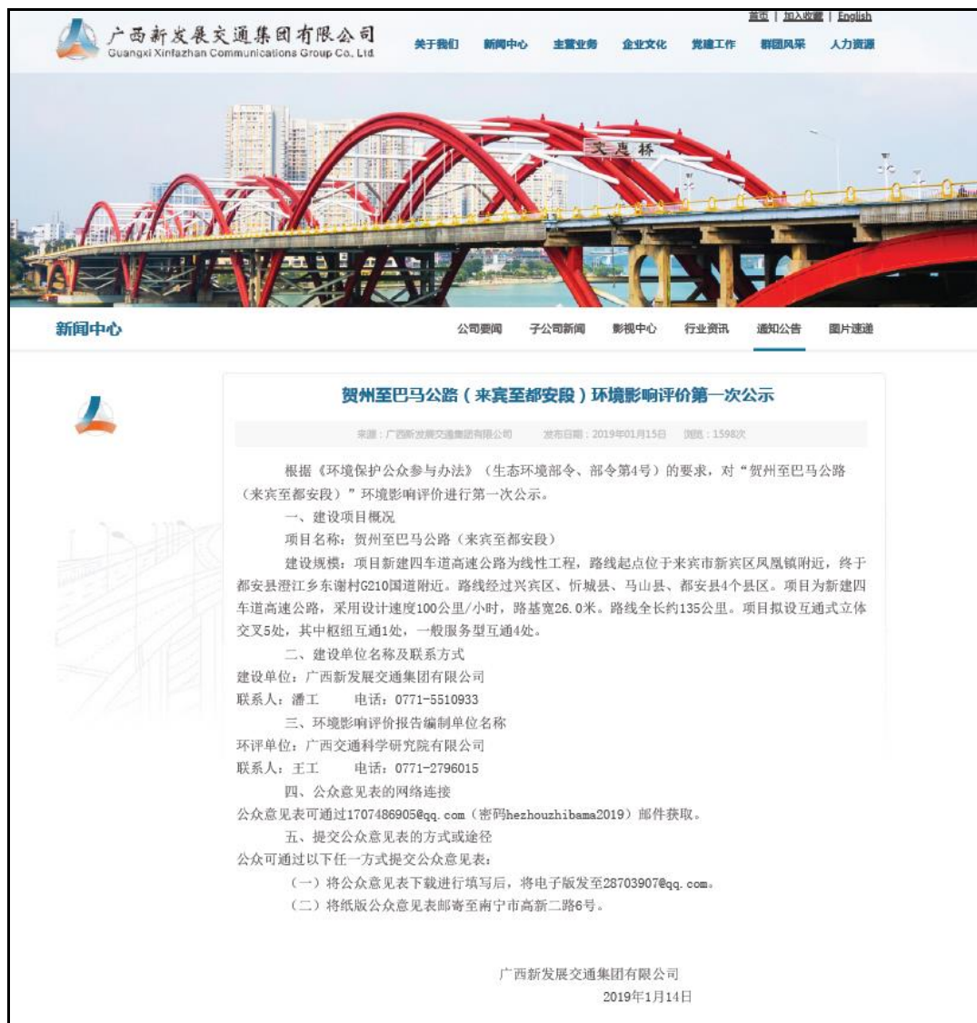
图1 广西新发展交通集团有限公司网站第一次公示

2019年1月14日在广西新发展交通集团有限公司网站上进行第一次项目环评信息公示，公示时间为10个工作日，公示内容为项目建设地点、工程概况、公众参与主要内容、公众参与的方式以及建设单位的联系方式等。截图见图1，公示网页见附件1。